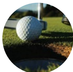
CAMPOS DE GOLF